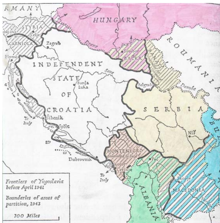
Скица 1. Распарчавање Југославије, 1941

Иако је у походу на Југославију Хитлер рачунао на помоћ својих савезника, због њихових територијалних аспирација, њихова помоћ није била само предност, већ и отежавајућа околност. То се видело већ пре почетка напада. Румунска влада је већ 3. априла била обавештена да ће мађарске трупе окупирати Банат (у изворном значењу – овде се мислило на западни део те историјске покрајине који је после Првог светског рата био додељен Југославији), па је запретила да ће у том случају и румунске трупе ући у југословенски део Баната. Већ наредног дана румунски амбасадор у Белину, Раул Боси, је службено протестовао против планиране мађарске окупације, изјавивши да Банат ни у будућности не може бити предат Мађарској. Суочен са овим отпором, Хитлер је 5. априла решио да мађарске трупе не учествују у освајању Баната. (Völkl, 1991) 1 Дана 12. априла у “Привремене смернице за поделу Југославије” које ће послужити