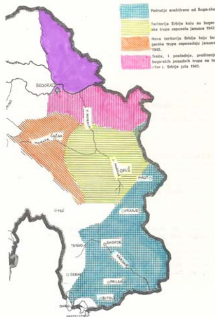
Скица 2. Део територије Југославије који је Бугарска анектирала и запосела у Другом светском рату.

Brailsford, 1906; Stojiljković, 1989; Ванас, 1988), а од које је Бугарској после Априлског рата припао велики део. (Stojiljković, 1989; Ćulinović, 1970; Petranović, 1988) Поред тога, Бугарска је желела да поврати два среза (Цариброд и Босилеград) које је после Првог светског рата изгубила у корист Југославије по Нејском уговору. (Stojiljković, 1989) Ови срезови су имали већинско бугарско становништво али их је Југославија добила из стратешких разлога, а делом и да би се Бугарска казнила због мучког напада на Србију 1915. Без обзира на то бугарски аспирације се нису завршавале на повраћају изгубљених територија од Србије. Немачке власти су дозволиле бугарским трупам да окупирају и анектирају и округе Врање и Пирот са око 200.000 становника. (Stojiljković, 1989) Сем тога, до јуна 1941. оне су под војном окупацијом држале и срезове Ниш, Лужница, Бојаница и делове Власотиначког и Паланачког среза, као и уски појас североисточно од Зајечара између Тимока и некадашње југословенско-бугарске границе. (Marjanović, 1963; Strugar, 1980; Schlarp, 1986) Намеравале су да окупирају и област око Неготина али је локални немачки командант то спречио. (Stojiljković, 1989) За чудо, преговори два у основи неједнака партнера су били дуги и нису довели до обострано задовољавајуће демаркационе линије. (Stojiljković, 1989; Glišić, 1982)