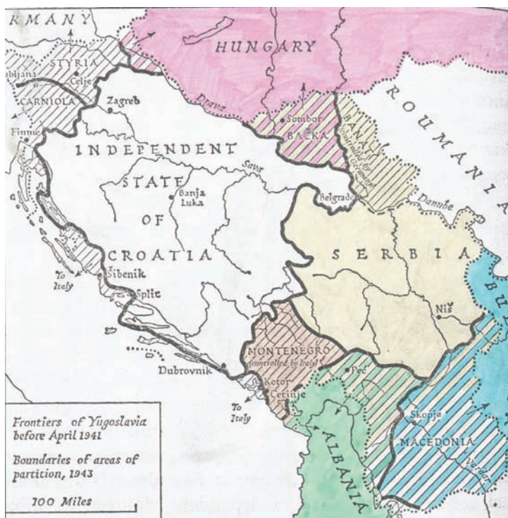
Figure 1. The dismemberment of Yugoslavia, 1941

Although Hitler counted on the aid of his allies in the campaign against Yugoslavia, their territorial aspirations made their assistance not only an asset, but also a liability. This was seen already before the beginning of the attack. The Romanian government was informed that Hungarian troops would occupy the Banat (in the original meaning of the word, designating here the western part of that historical province that had been allotted to Yugoslavia after WWI) already on April 3 and threatened Romanian troops would also enter the Yugoslav part of the Banat in that case. Already on the next day, Romanian ambassador to Berlin Raoul Bossy, protested officially against the planned Hungarian occupation and stated that not even in the future could the Banat be given over to Hungary. Faced with this resistance, Hitler had to yield and he decided on April 5 that Hungarian troops wouldn't take part in the conquest of the Banat (Völkl, 1991) 2 . On April 12 the provision that the Yugoslav part of the Banat would be